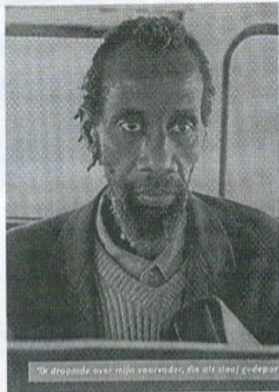
"Ik droomde over mijn voorvader, die als slaaf geëxporteerd werd"