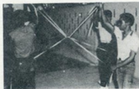
Grupo Korsow(Nos Legria)