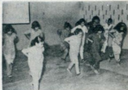
Grupo di India