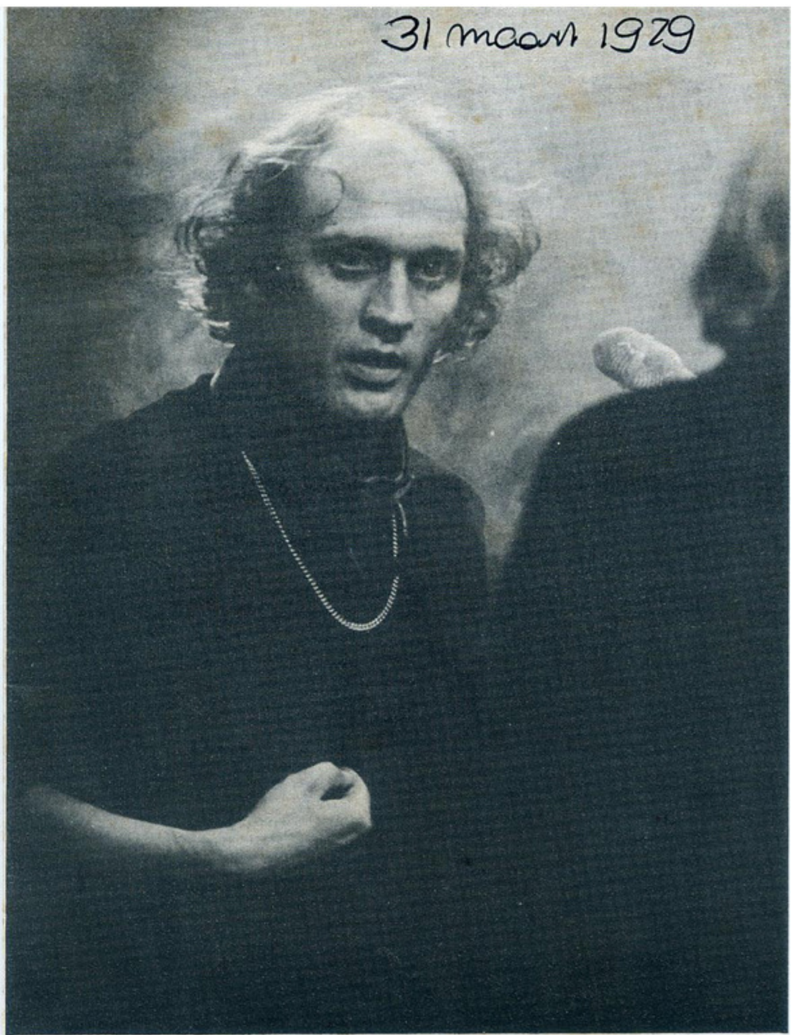
HERMAN VAN VEEN OP CURAÇAO