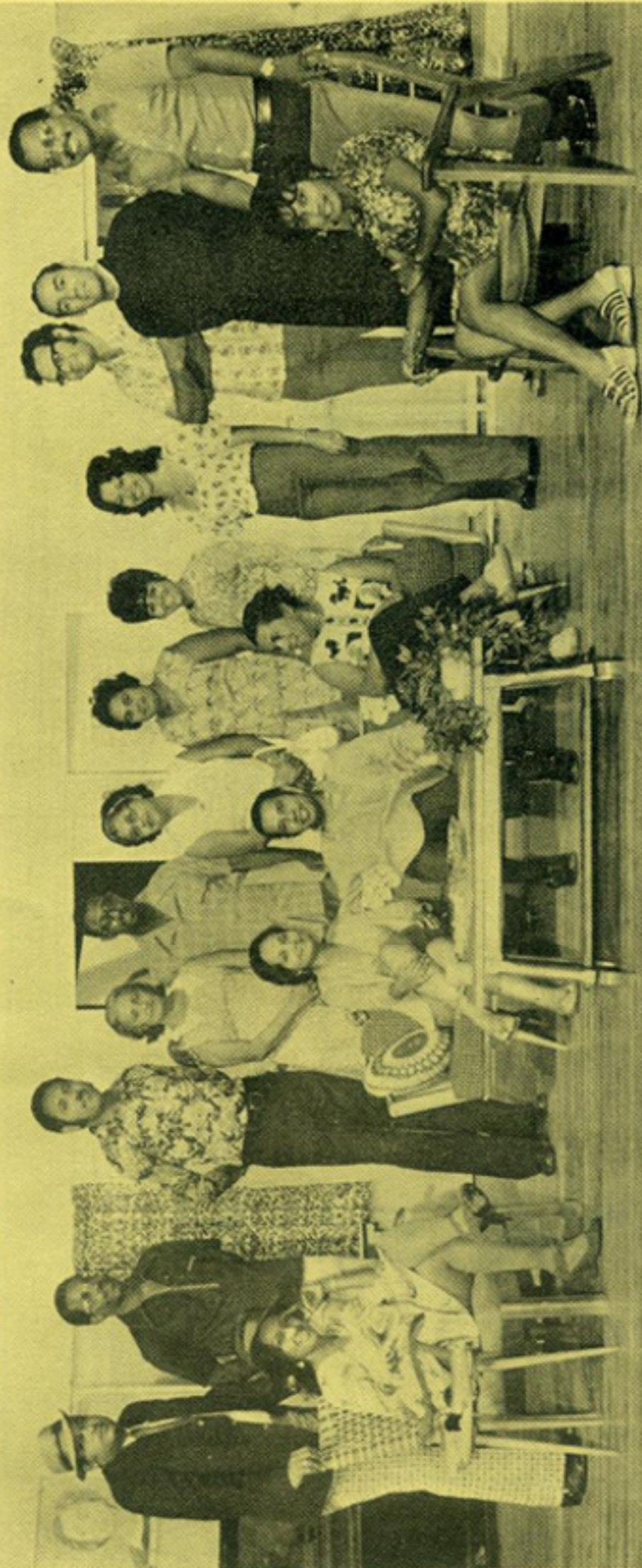
DIREKTOR, ACTOR I ACTRIZ I KOLABORADORNAN DI "KONTAMI PA MI SA"