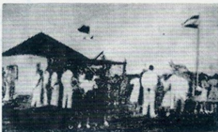
HET OUDE CLUBHUIS 1938 — 1940